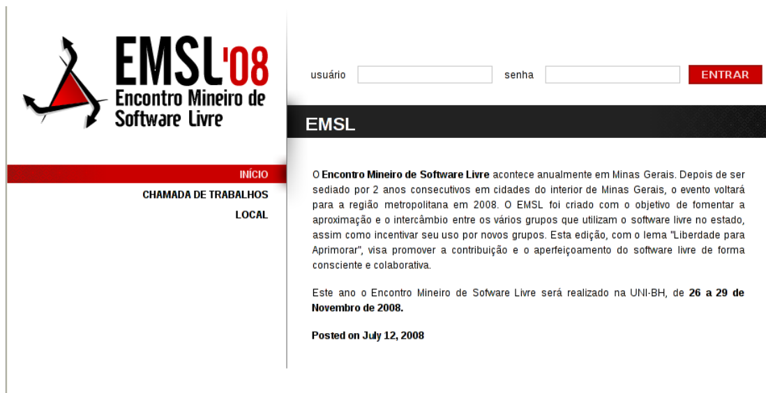
Figura 1: Site do evento ( http://emsl.minaslivre.org )

A página inicial do site do EMSL está na figura 1.